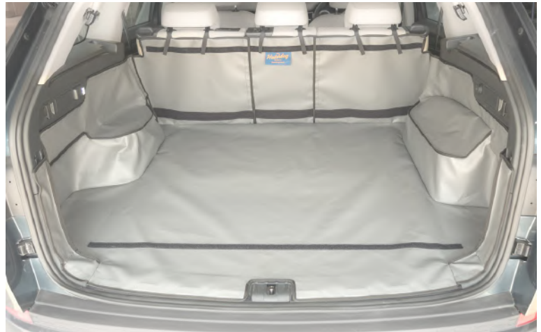
Kofferraumschutz mit geteilter Rücksitz vorbereitet für den Rücksitzschoner. Stoßtangenschutz und verlängerung der Kofferraumauskleidung